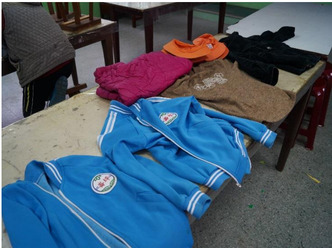
二手制服回收再利用