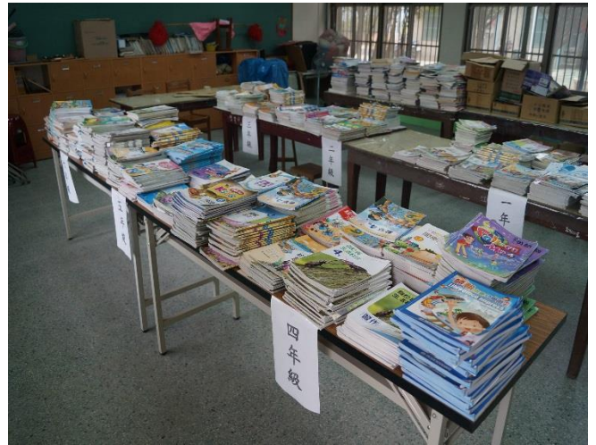
二手教科書回收再利用