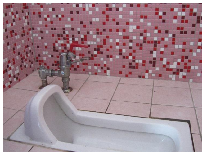
節約用水具體作為---二段式沖水馬桶