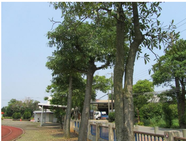
校園植物以在地原生種多樣植栽為主