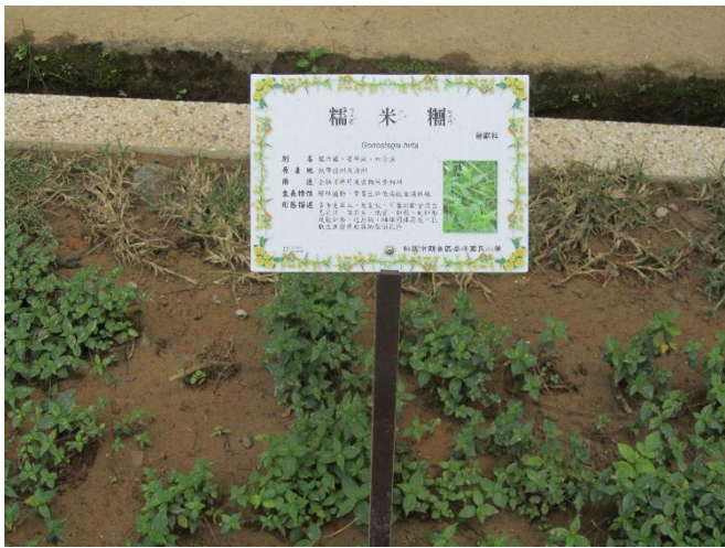
校園植物以在地原生種多樣植栽為主