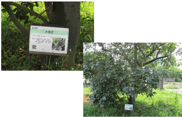
校園植物以在地原生種多樣植栽為主