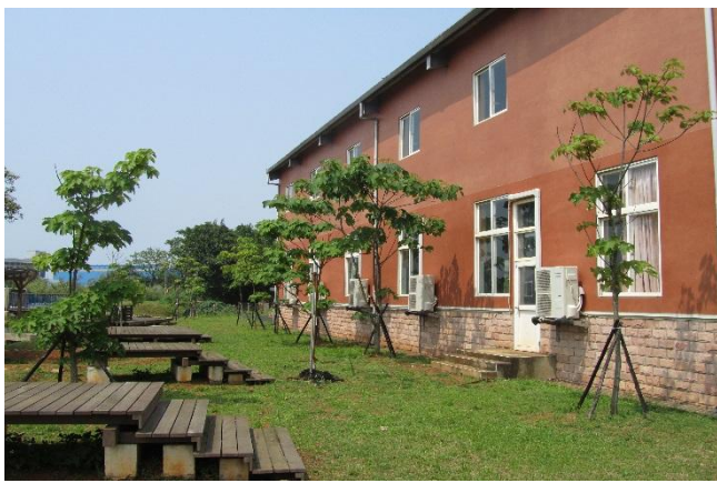
校園植物以在地原生種多樣植栽為主