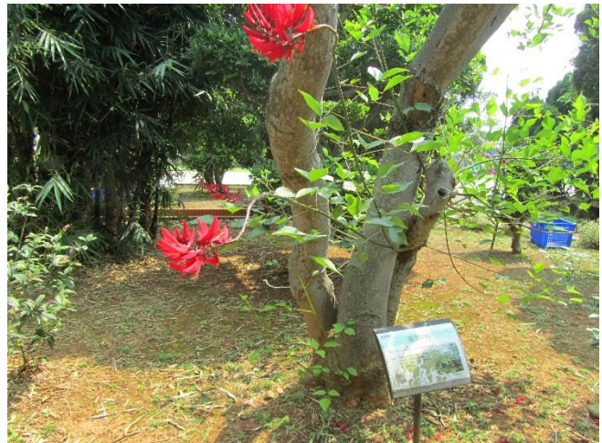
校園植物以在地原生種多樣植栽為主