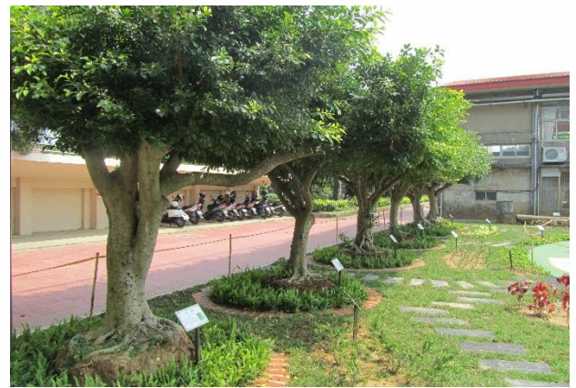
校園植物以在地原生種多樣植栽為主