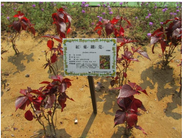
校園植物以在地原生種多樣植栽為主