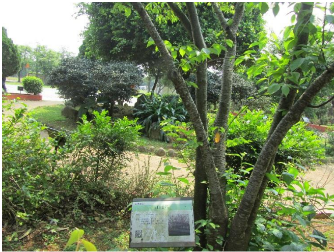
校園植物以在地原生種多樣植栽為主