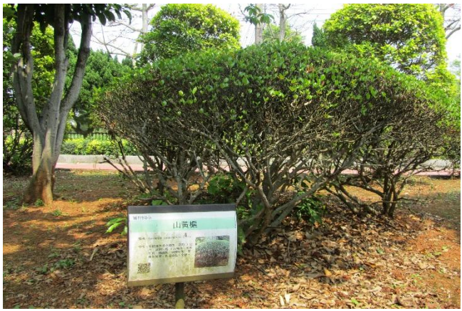
校園植物以在地原生種多樣植栽為主