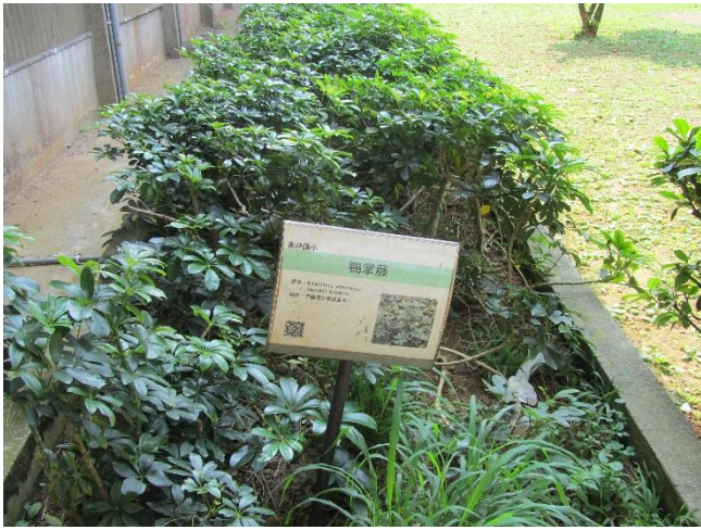
校園植物以在地原生種多樣植栽為主