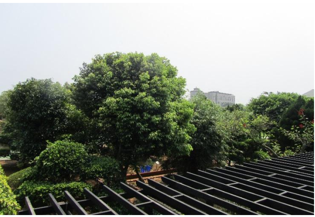
校園植物以在地原生種多樣植栽為主