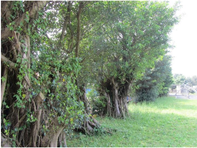
校園植物以在地原生種多樣植栽為主