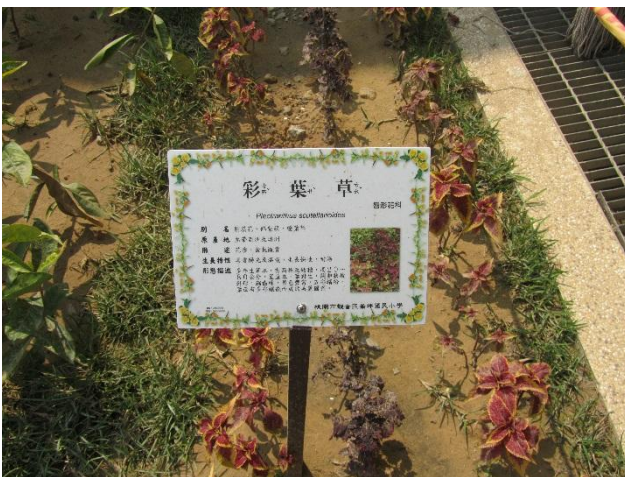
校園植物以在地原生種多樣植栽為主