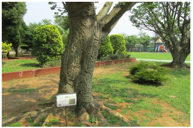
校園植物以在地原生種多樣植栽為主