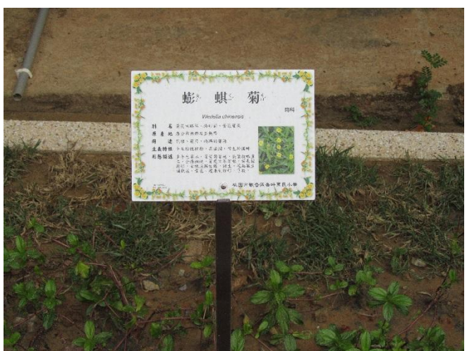
校園植物以在地原生種多樣植栽為主