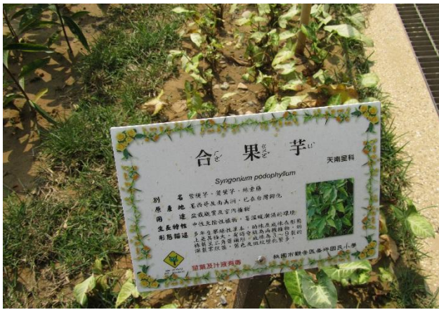
校園植物以在地原生種多樣植栽為主