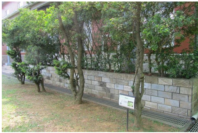
校園植物以在地原生種多樣植栽為主