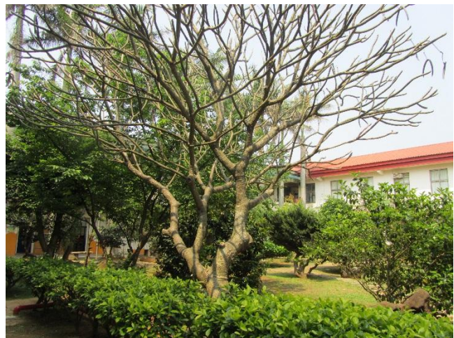
校園植物以在地原生種多樣植栽為主