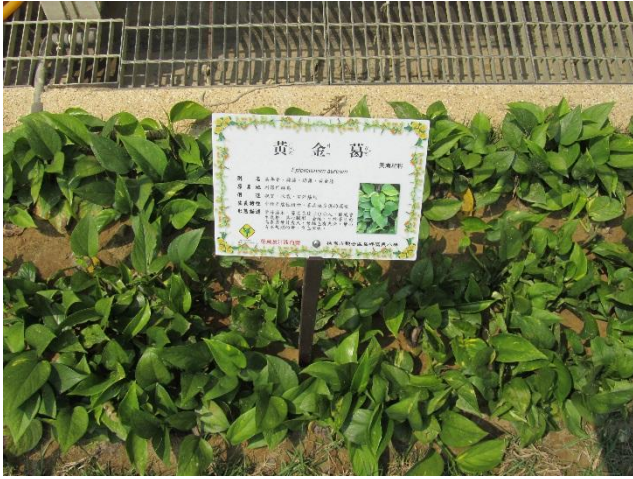
校園植物以在地原生種多樣植栽為主