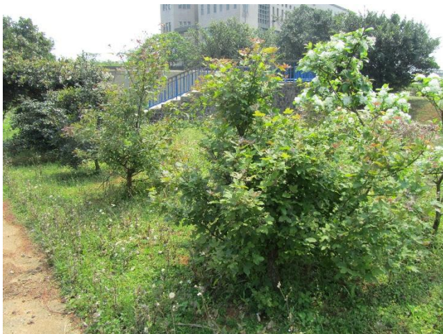
校園植物以在地原生種多樣植栽為主