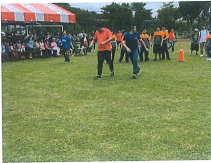
親子趣味競賽讓家長參與健康促進活動