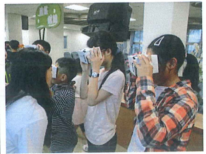
防盲協會志工蒞校宣導保眼的重要性