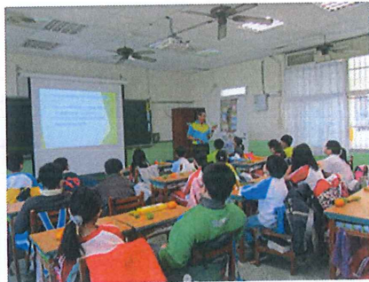
健康體位議題教學活動