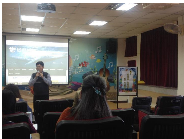
參加綠階/初階海洋教育者培訓及課程設計