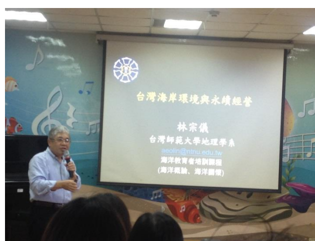
參加綠階/初階海洋教育者培訓及課程設計