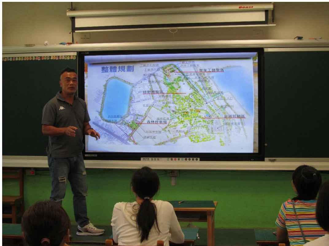
教師專業學習社群-崙坪埤環境生態