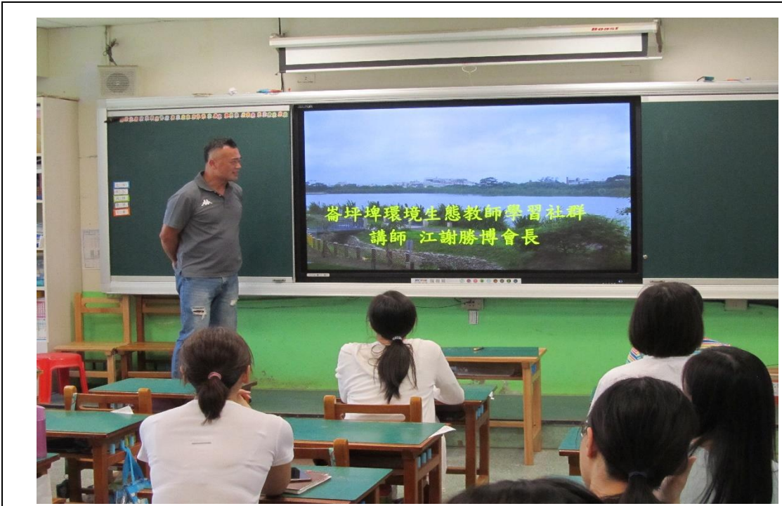
教師專業學習社群-崙坪埤環境生態