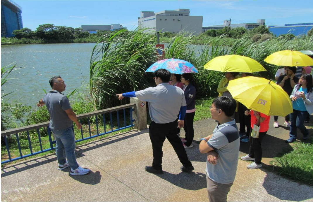
教師專業學習社群-崙坪埤環境生態實地探討