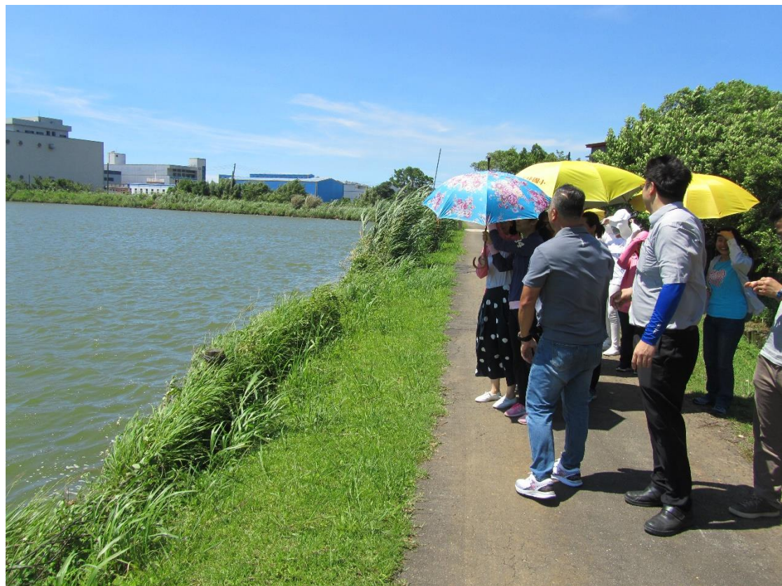
教師專業學習社群-崙坪埤環境生態實地探討