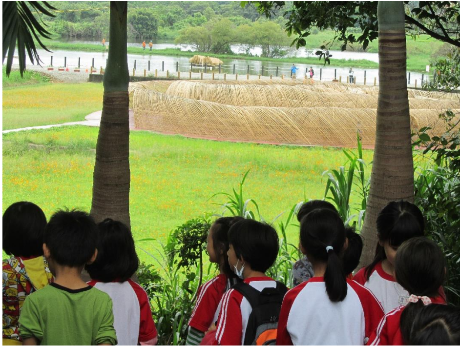
辦理全校環境教育踏查活動