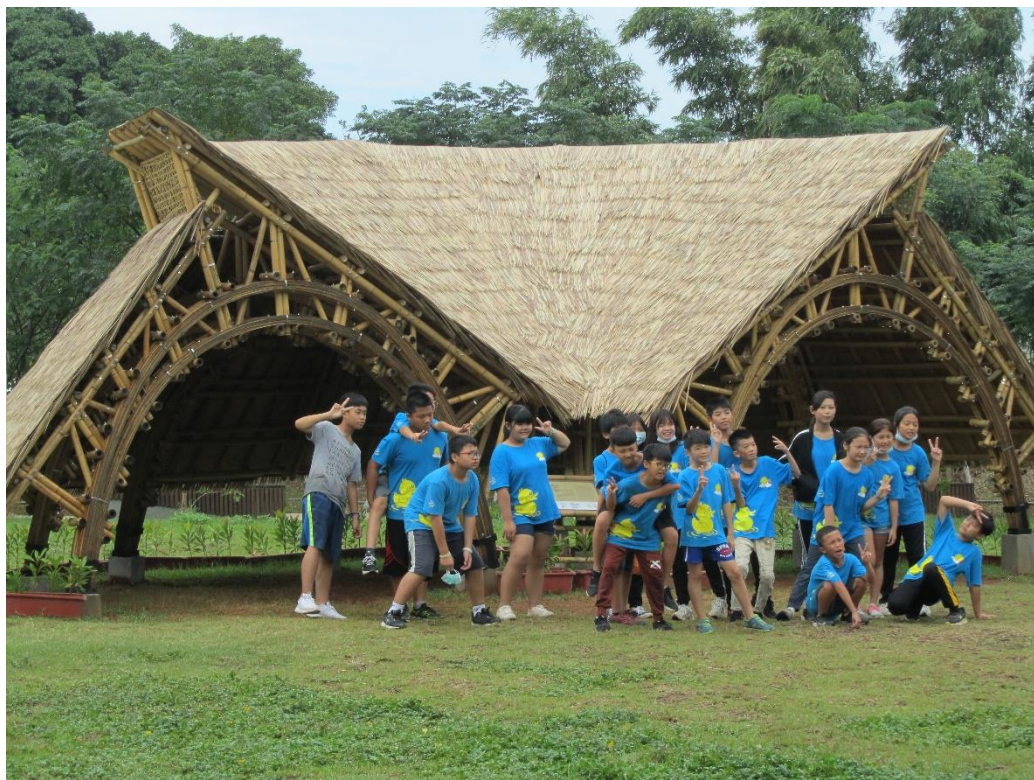
辦理全校環境教育踏查活動