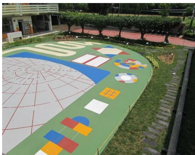
校園鋪設親水鋪面