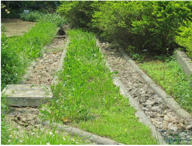
校區水溝運用礫石鋪面透水性更高