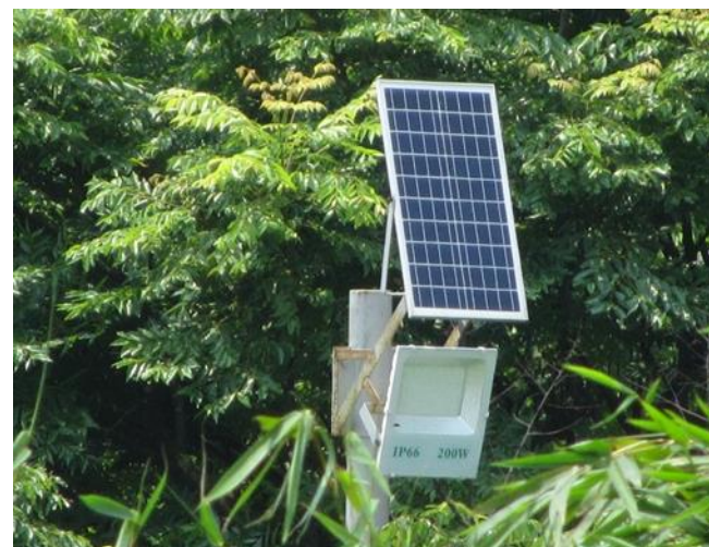
設置太陽光電照明設備系統