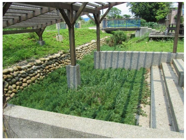
利用天然環境設置水生植物觀察區